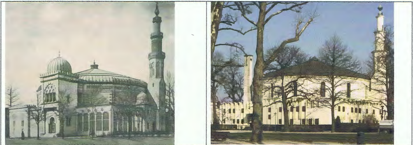
L'ancienne rotonde du panorama du Caire construite en 1879 dans le parc du Cinquenaire de Bruxelles. C'est aujourd'hui la Grande mosquée de Bruxelles.

- le style de la rotonde de Sainte-Anne-de-Beaupré s'harmonise avec la thématique de l'œuvre d'art qu'elle renferme. Elle est, avec l'ancien panorama du Caire à Bruxelles, une des rares rotondes de panorama à s'inspirer d'un style oriental.