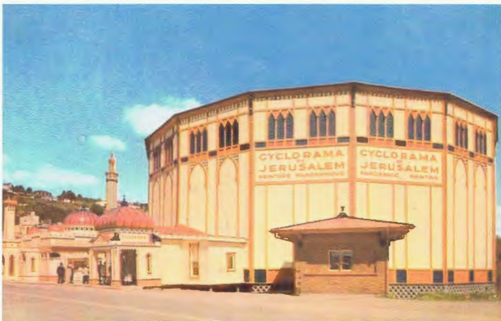
Cyclorama de Jérusalem tel qu'il s'est présenté entre 1925 et le début des années 1980.